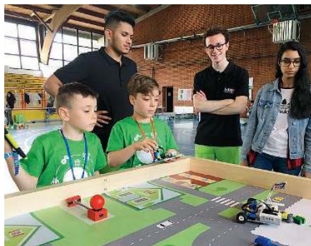
I giudici controllano le invenzioni. I ragazzi provano le loro macchine