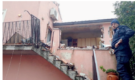
L'ESPLOSIONE IN UN'ABITAZIONE DI VIA ROMA

Fuga di gas in un'abitazione di via Roma a San Giovanni La Punta. Ieri mattina è letteralmente esplosa una casa con all'interno il proprietario. Poteva succedere una vera e propria tragedia, ma fortunatamente l'uomo si è salvato. La casa è andata distrutta. Ma andiamo per ordine. L'uomo, 65enne e molto conosciuto a San Giovanni La Punta, si trovava in cucina per preparare il pranzo. In quel momento due fornelli erano accesi con sopra due pentole. Un terzo fornello, per cause ancora da accertare, risultava aperto ma non acceso. Proprio da questo fornello è uscito il gas che, pian piano, ha riempito tutta la casa. Il 65enne, però, non si è accorto della perdita. Per cause ancora in corso, appena l'ambiente è diventato sa-