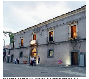
PALAZZO PARTANNA OSPITA GLI UFFICI COMUNALI