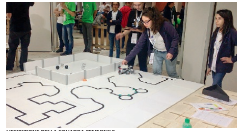
L'ESIBIZIONE DELLA SQUADRA FEMMINILE