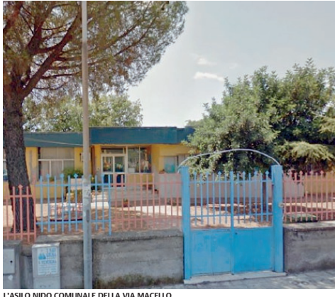
L'ASILO NIDO COMUNALE DELLA VIA MACELLO

L'importo complessivo del progetto in via Macello è di 423mila euro, in parte con fondi comunali e il resto con una somma assegnata dall'assessorato regionale al Dipartimento della Famiglia e delle Politiche sociali. Tante le opere e gli interventi previsti dal progetto tra cui garantire adeguate condizioni di si-